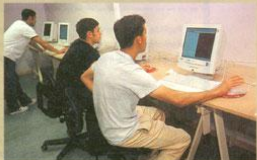
Gratisurfing: Internettkaféen er et trekkplaster som ungdomsteamene veit å bruke når de er på by'n og vil ha folk i tale.